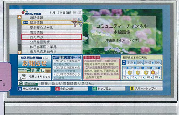
データ放送 トップ画面イメージ

11チャンネルのデータ放送にて掲載 テレビなどのリモコンボタンで情報を選択します。